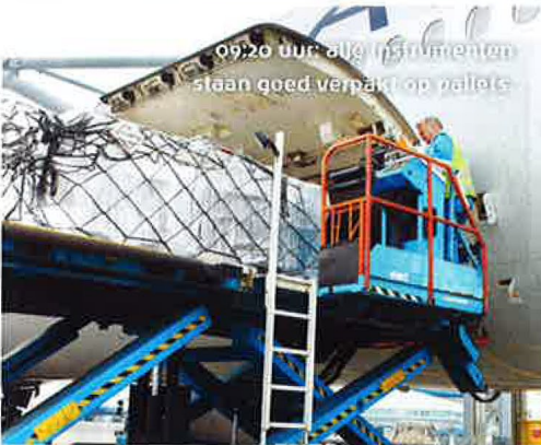
09.20 uur alle instrumenten staan goed verpakt op pallets