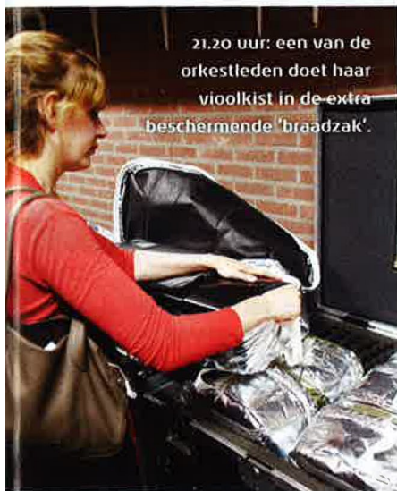
21.20 uur: een van de orkestleden doet haar vioolkist in de extra beschermende 'braadzak'.