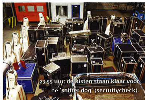
23.55 uur: de kisten staan klaar voor de 'sniffer dog' (securitycheck).