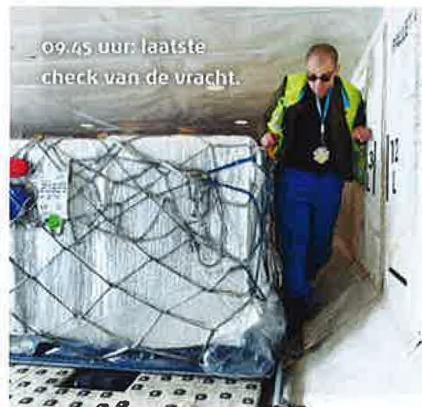
09.45 uur laatste check van de vracht.