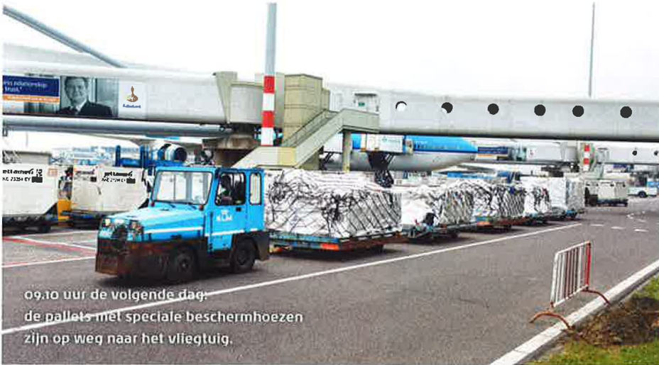
09.10 uur de volgende dag: de pallets met speciale beschermhoezen zijn op weg naar het vliegtuig.