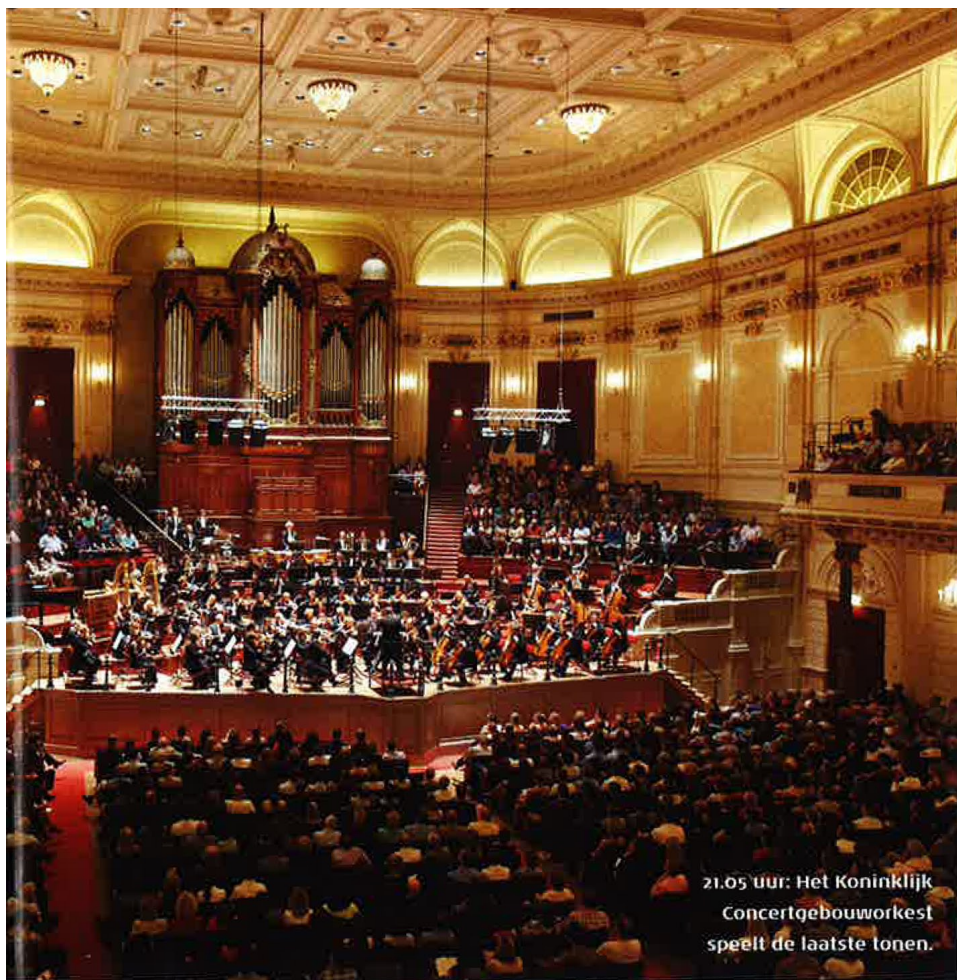
21.05 uur: Het Koninklijk Concertgebouworkest speelt de laatste tonen.