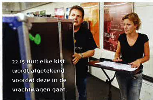
22.15 uur: elke kist wordt afgetekend voordat deze in de vrachtwagen gaat.