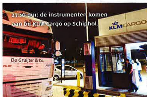
23.30 uur: de instrumenten komen aan bij KLM cargo op Schiphol.